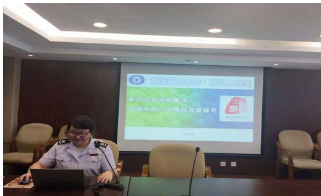
纳税人学堂上税务干部在给新办企业介绍纳税信用管理

标准、激励惩戒措施等方面内容，提高纳税人守信、增信意识，促进依法纳税诚信经营，营造良好社会信用环境。在宣传月活动期间按要求使用统一的标识，推进诚信兴商宣传月活动品牌深入人心。利用纳税人学堂向新办企业介绍纳税信用管理知识和区局纳税信用建设现状，助力社会信用体系建设。