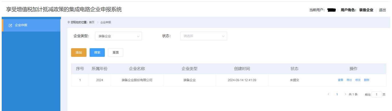
图 2-3 企业申报-列表页面

特别建议：因填报和提交的扫描文件较多，相关内容可能需要企业多个部门协同完成。因此建议正式申报之前，应点击【添加】按钮，记录申报页面需要填报和提交的扫描文件，分发给各部门筹备，指定负责人收集相关资料后统一进行申报操作。