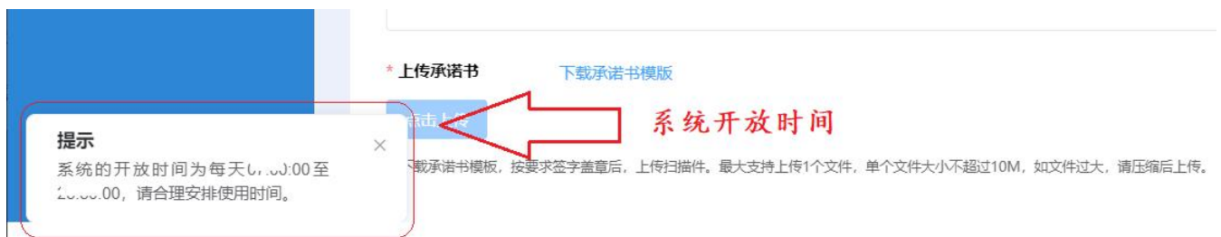
图 2-9 系统开放时间

点击“企业申报”模块名称，进入列表页面。点击【添加】按钮进入信息填报页面。请认真阅读“填报说明”关于填报时间、政策要求等相关信息。申报企业应在规定时限内提交申报材料，逾期系统将关闭通道。同时，本系统会结合实际工作安排，适时关闭夜间访问，请申报企业合理安排使用时间。