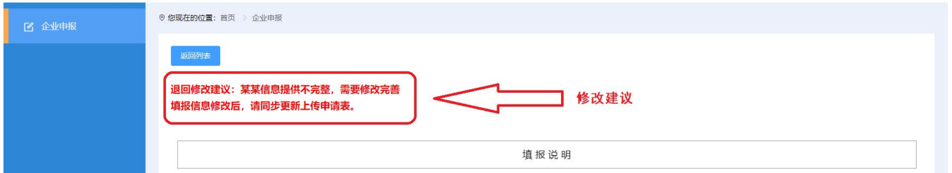
图 2-4 企业申报-退回修改